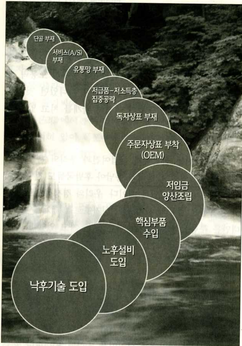
주 : <신사고 이론20>(1995년)