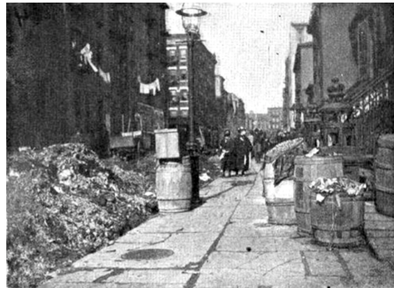
1893 New York: Schmidt, 2010, on earth