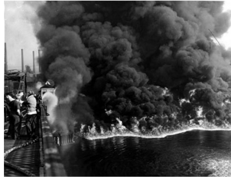
Cuyahoga River Fire, Nov 03, 1952: http://www.ohiohistorycentral.org